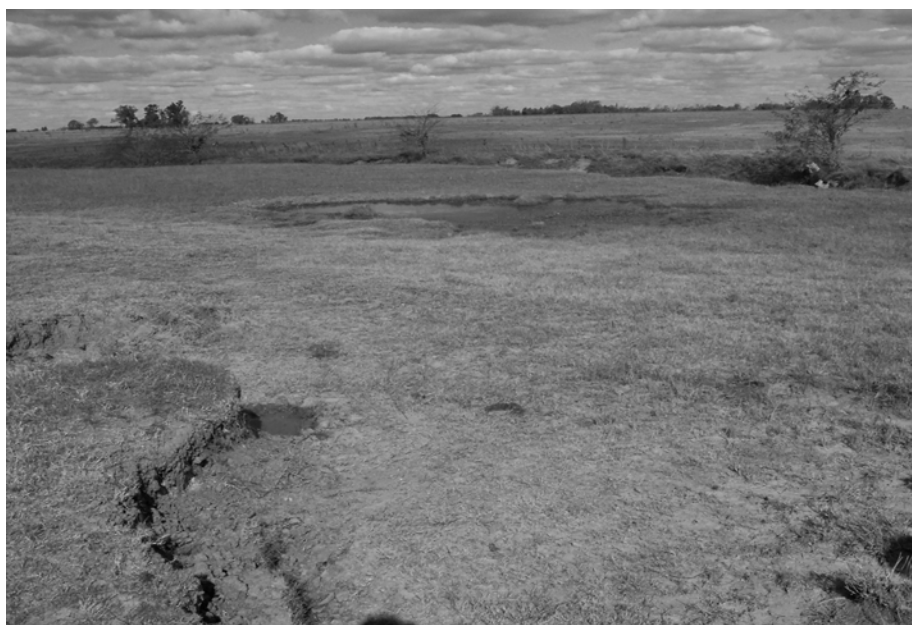
Figura 2. Ejemplo de una pequeña cubeta de acumulación de agua de escurrimiento (<math><100\text{ m}^2</math> de superficie y <math><50\text{ m}^3</math> de volumen) ubicada en el plano aluvial del Arroyo del Tala. Se advierten signos de erosión hídrica severa.

Los sitios experimentales incluyeron campos ganaderos extensivos con diversa carga animal (sitios 1-6) y un «feedlot» (sitio 7). La carga animal variaba entre 200 y 15.000 kg de peso vivo por hectárea (Tabla 1) y fue calculada para cada lote en el que se encontraban las depresiones bajo estudio con influencia directa sobre dichas depresiones.